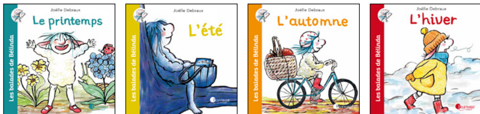
Albums de 16 pages

4 albums autour des saisons et de la relation au vivant :